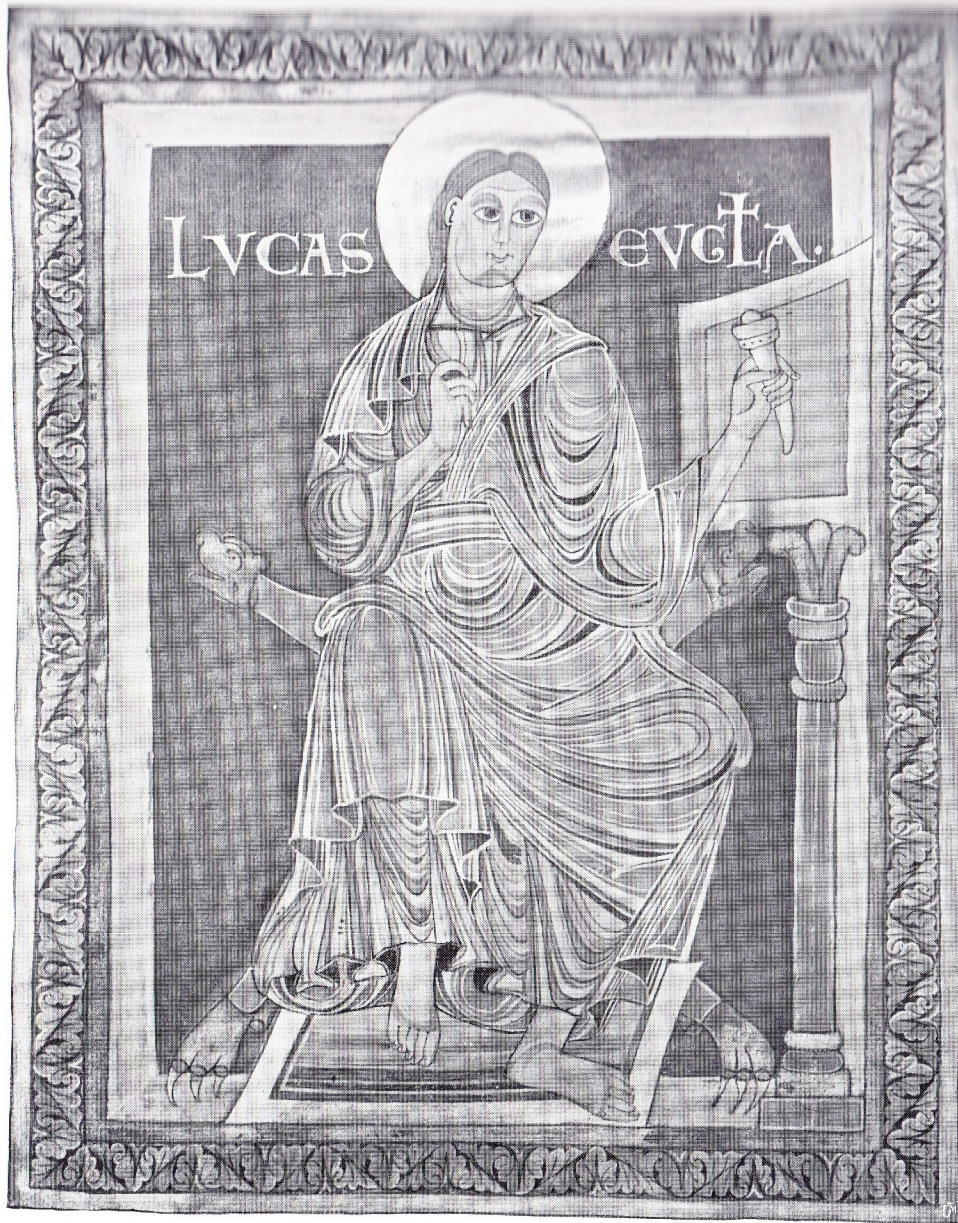
9. — L'ÉVANGÉLISTE SAINT LUC.